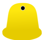
Metale i tworzywa sztuczne

Odbiór odpadów z podziałem na 5 poniższych frakcji: