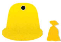
METALE I TWORZYWA SZTUCZNE